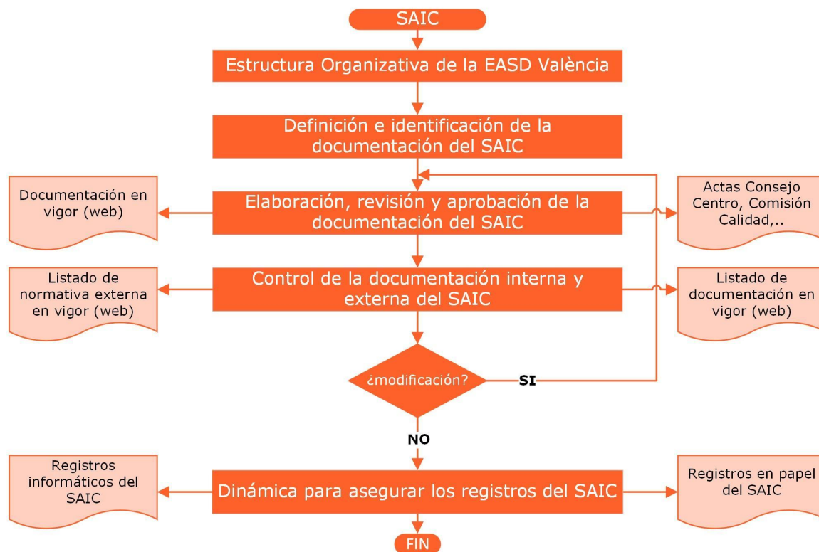
Diagrama Gestión SAIC