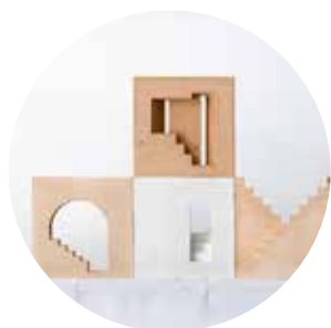
MARIÀ CASTELLÓ m-ar.net