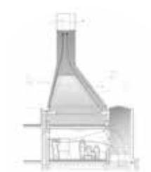
H ARQUITECTOS harquitectes.com