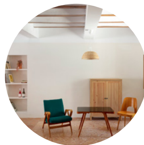
CRUX ARQUITECTOS cruxarquitectos.com