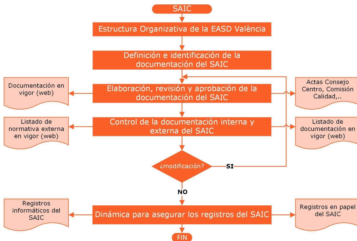
Diagrama Gestión SAIC