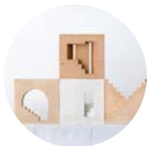
MARIÀ CASTELLÓ m-ar.net