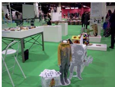
Imágenes del stand de la EASD Valencia en FIMI, enero de 2013

Pero un poco antes, en Julio del 2012, FIMI nos da noticias sobre algunos expositores que generan apuestas atrevidas por algunos de los conceptos que nuestro máster pretende trabajar. Estos expositores muestran su interés por las fibras naturales o por el espíritu del slow fashion reinventando el valor de lo tradicional, artesanal. La relación de expositores se encuentra a continuación: