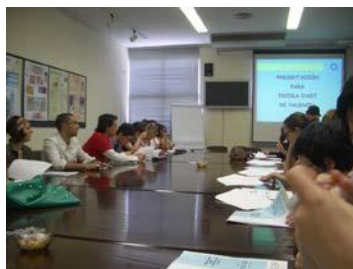
📍Visita a INESCOP, año 2006→